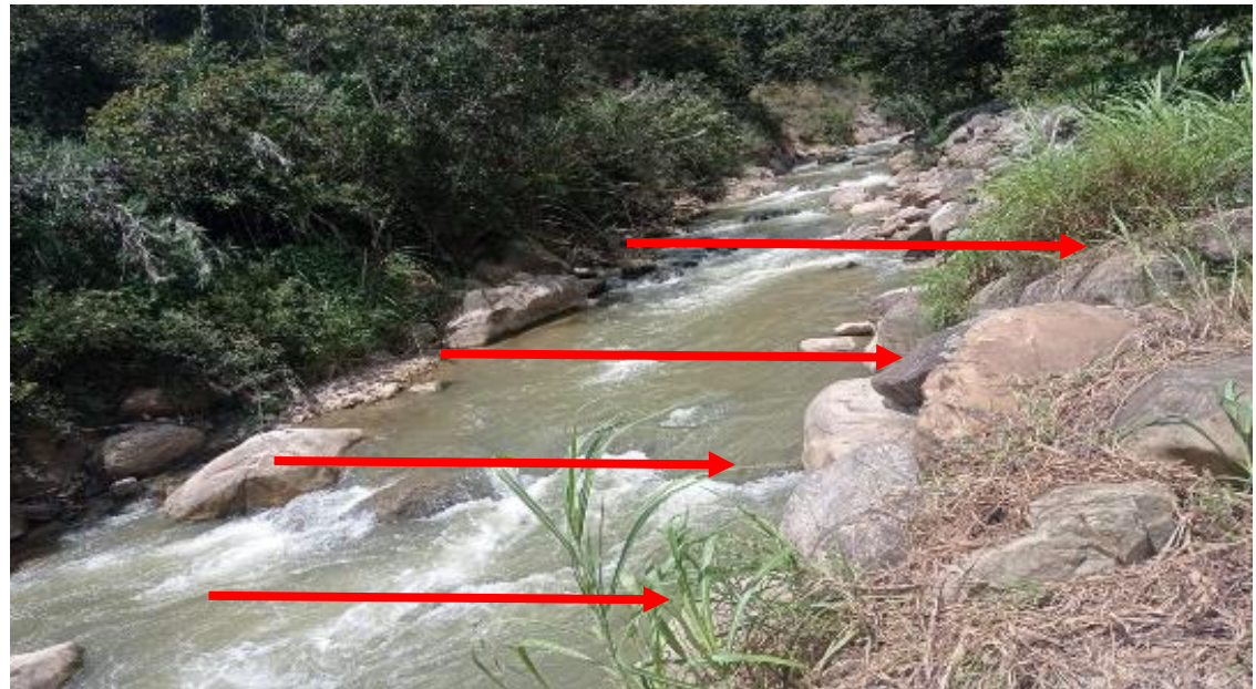
FOTOGRAFIA N°02: ZONA A PROTEGER EN LA MARGEN IZQUIERDA DEL RRÍO SUCSE (RIO SUCCINO).