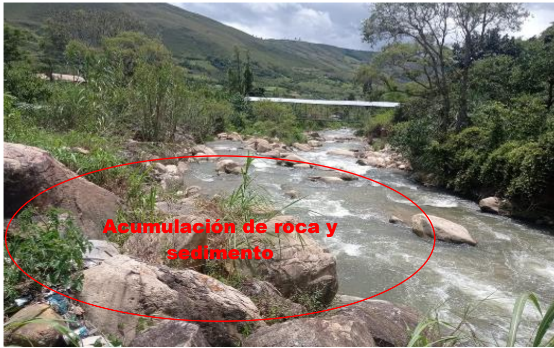
FOTOGRAFIA N°01: TRAMO CRÍTICO EN EL RÍO SUCSE (RIO SUCCINO), CON ACUMULACION DE ROCA EN EL CAUCE, SECTOR SUCCE.